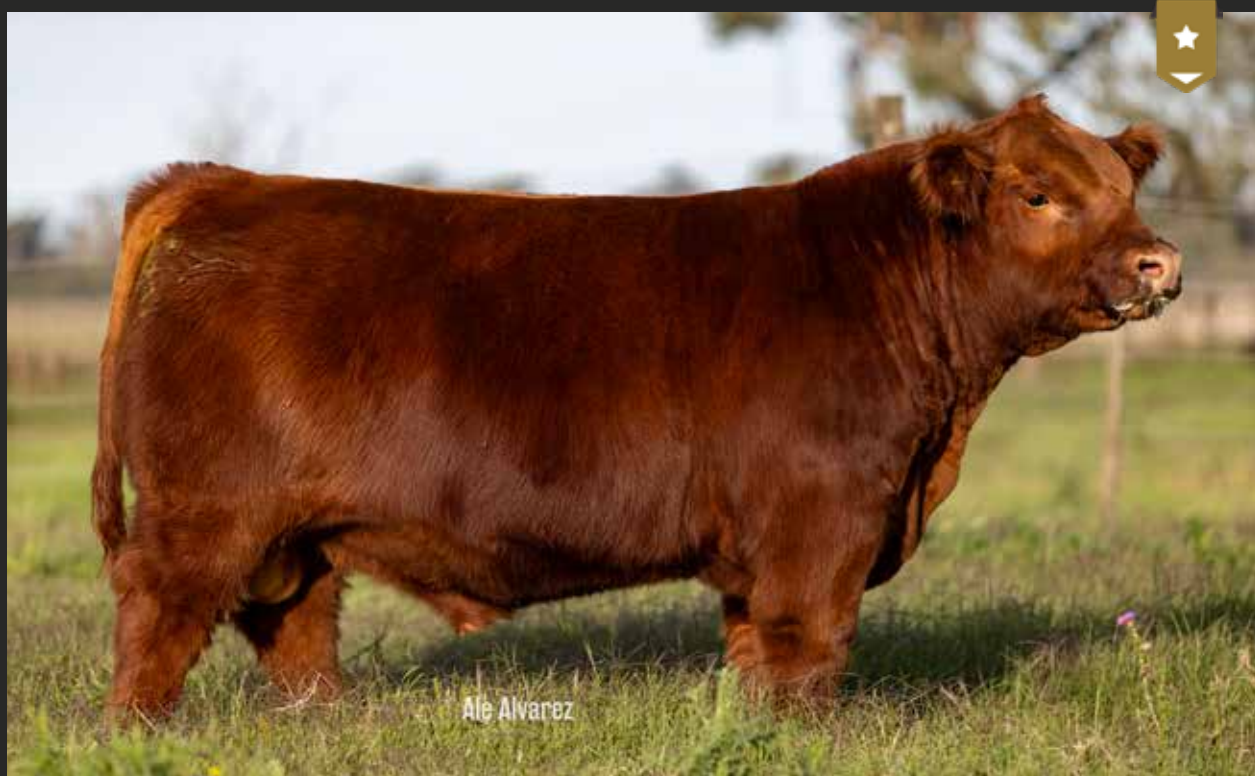
FONTANA 9409 - Hijo de RECORD x Fontana 408