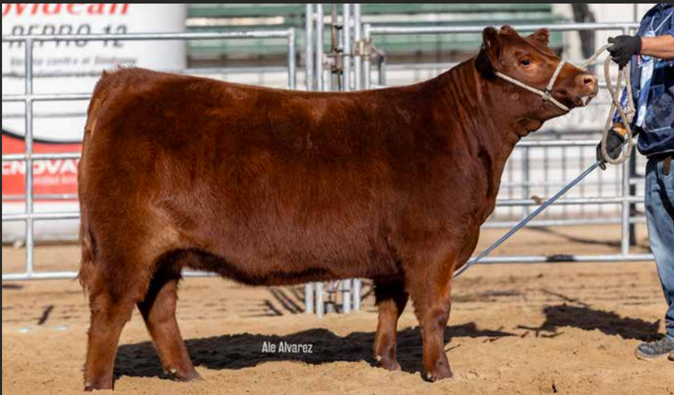
RP 9345 MEJOR TERNERA INDIVIDUAL DE LOTE Rubeta S.A. - Bototi Picu