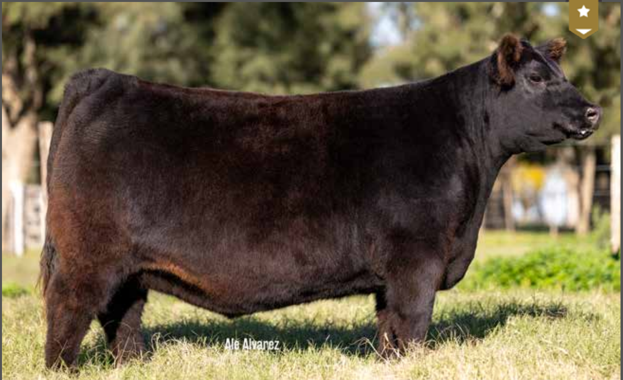
HEIDI 9288 - Hija de NAPOLITANO x Heidi 8093