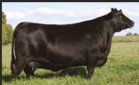
FORJADORA 4625. Fundadora de esta gran familia.