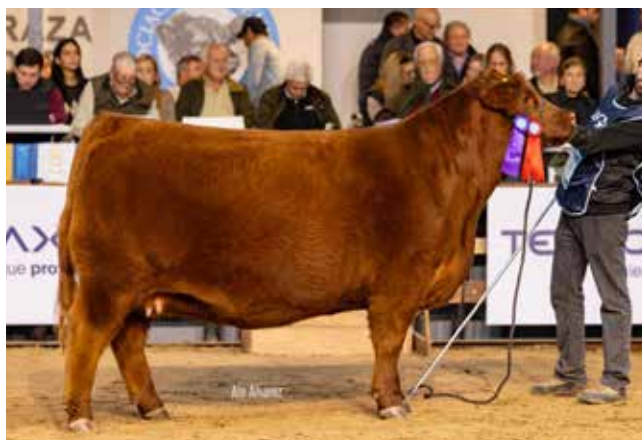
RESERVADA DE CAMPEÓN VAQUILLONA MAYOR Quequen Sur / La Rubeta