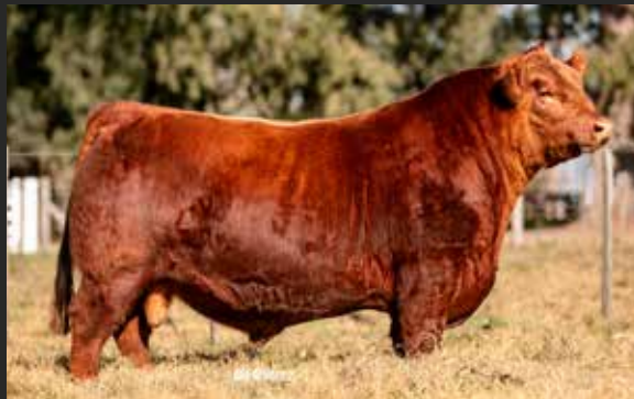
VIRREY Scotch -7763 - Density