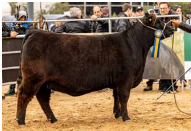
3° MEJOR HEMBRA INDIVIDUAL LOTE La Rubeta / La Pasión / Don Benjamín