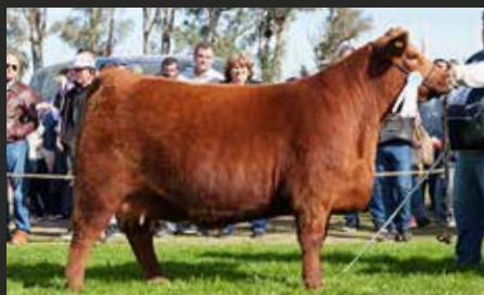
Bototí Picu 1808, su hija. Gran Campeón Hembra Villaguay 2025.