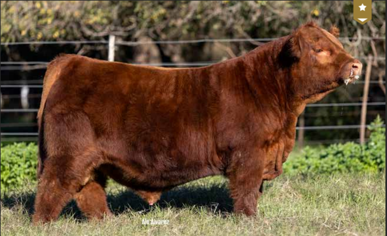
MULATA 447 - Hijo de MATEO x Mulata 8302