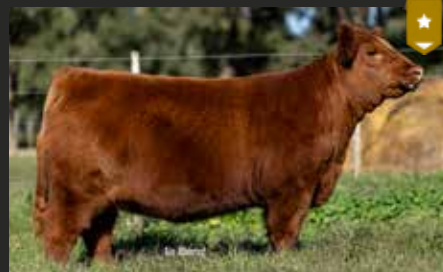
HEIDI 9453, su hija. Ternera Destacada Nueva Generación 25.