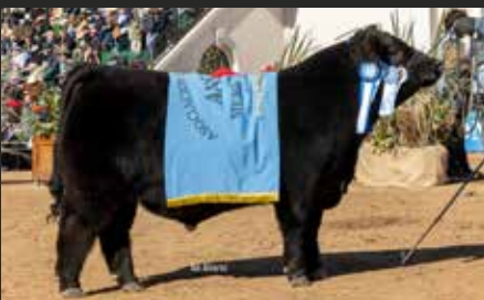
AMALAYA, su hijo. Gran Campeón Ternero y 3er Mejor Macho Palermo 25