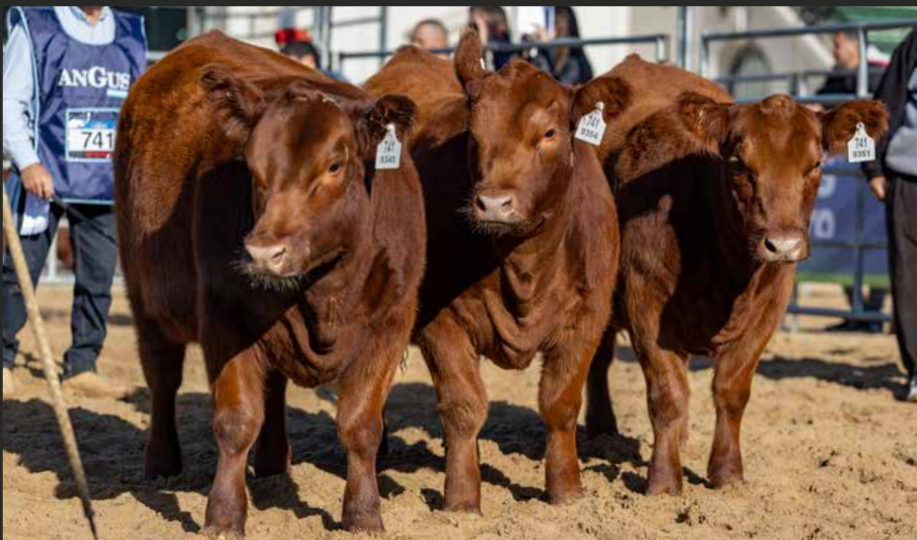
RP 9345, RP 9351 Y RP 9354 LOTE GRAN CAMPEÓN TERNERA Y CAMPEÓN TERNERA MAYOR Rubeta S.A. - Bototi Picu (UY)