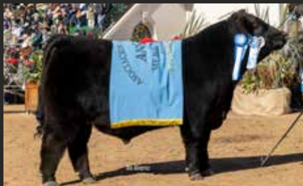
AMALAYA Mejor Ternero y Tercer Mejor Macho Palermo 25.