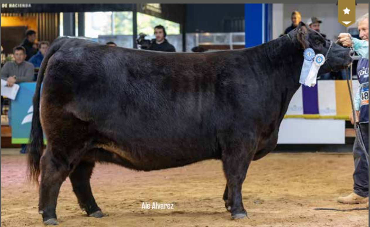
HEIDI 9061 - Hija de ANICETTO x Heidi 8093