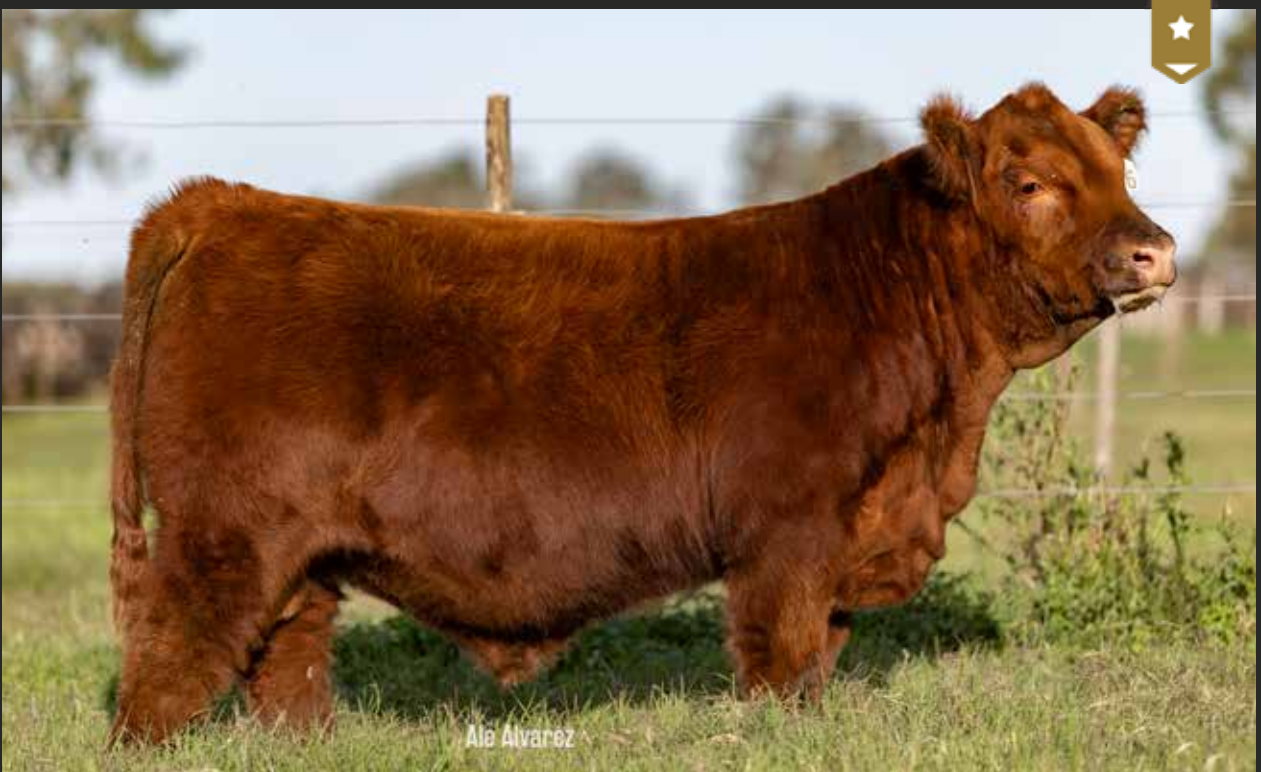
MULATA 9466 - Hijo de PUAL x Mulata 8975