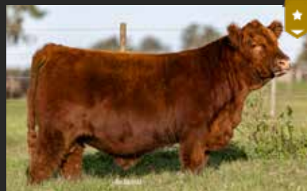
MULATA 9466, su hijo. Ternero Destacado Nueva Generación 25.