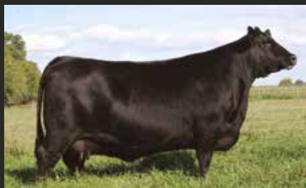
FORJADORA 4625, su madre. Madre del año Angus.