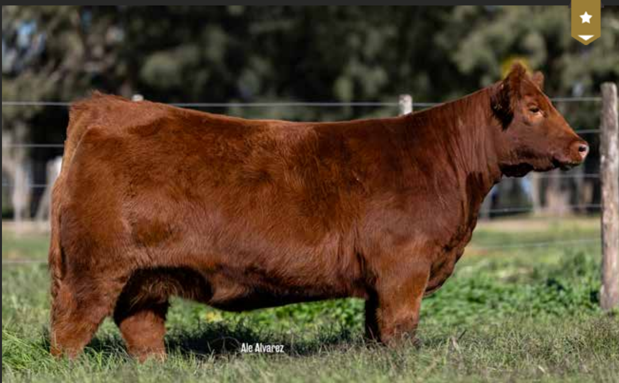
MONTANA 9351 - Hija de HALCON x Montana 7950