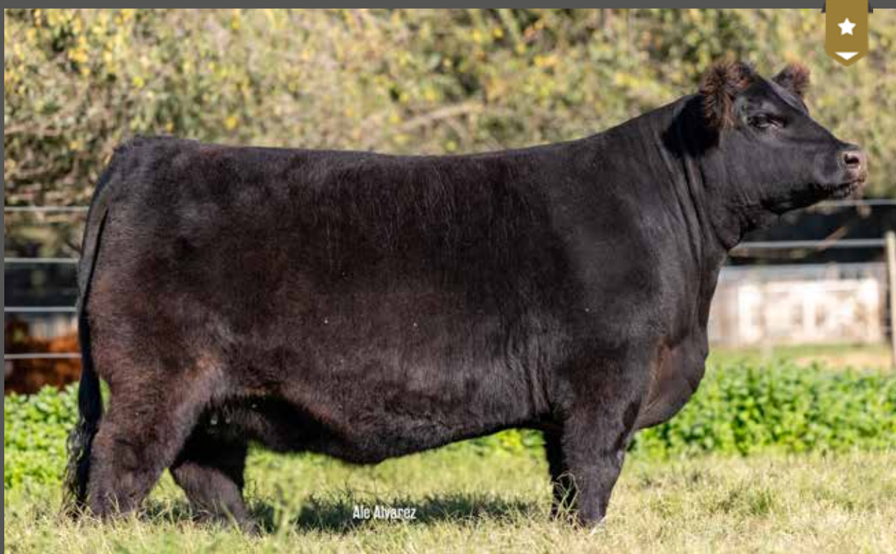
BLACKCAP 9295 - Hija de MATEO x 8119