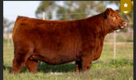
FONTANA 9391, su hija. Terñera Destacada Nueva Generación 25.