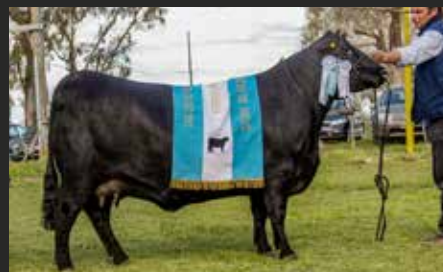
FORJADORA 5876, su madre. Gran campeón Hembra Nacional.