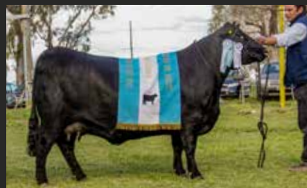
FORJADORA 5876, su hermana. Gran Campeón Hembra Nacional.

UNA DE LAS ÚLTIMAS HIJAS DE FORJADORA 4625.