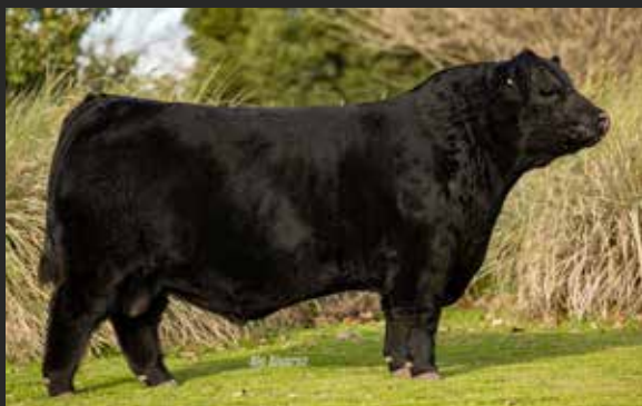
PICANTE Batacazo - T.M. A766 - SAV Resource