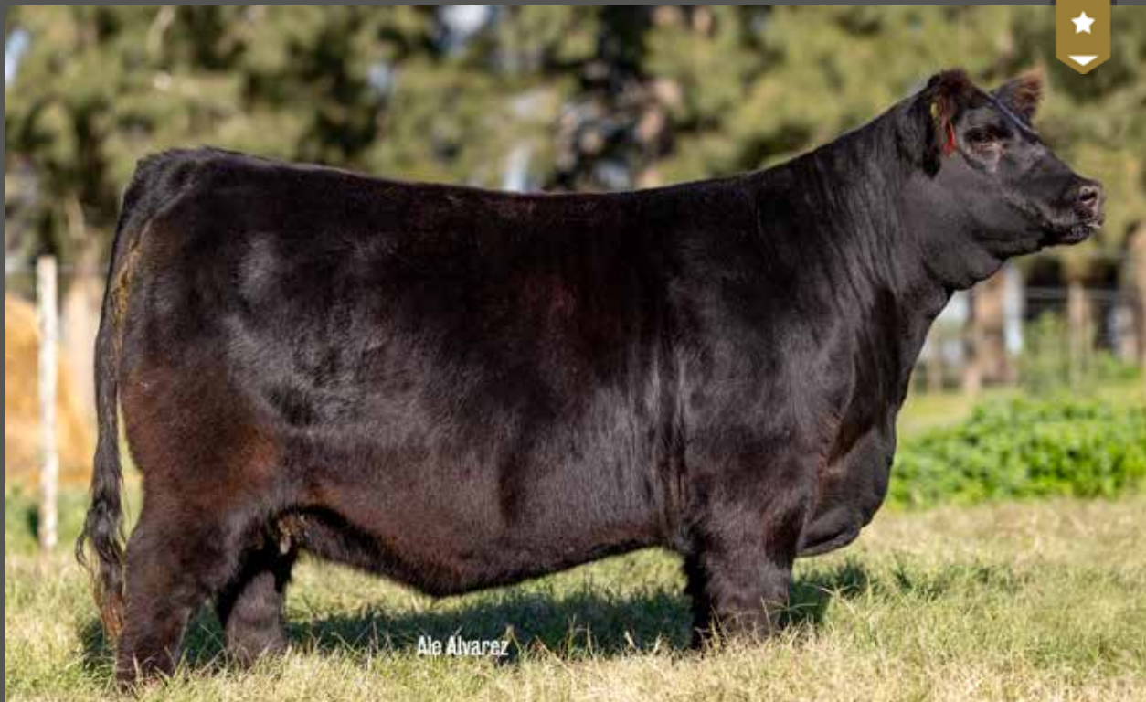
BLACKCAP 9234 - Hija de DON JOSE x Blackcap 8118