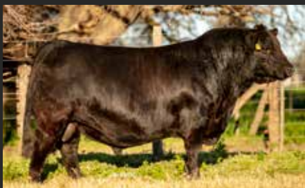
GRAN HERMANO, su hijo. Precio Máximo Remate LR. En Genpro.