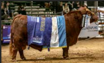
HALCÓN, su hermano, BI-Gran campeón otoño 23 y 24. En Select Debernardi.