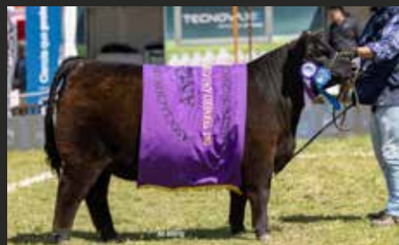
BLACKCAP 9295, su hija. Res. Gran Campeón Ternera Nacional 25.