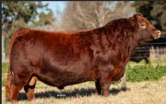
HALCON Prolijo - 6589 - Quebrantador