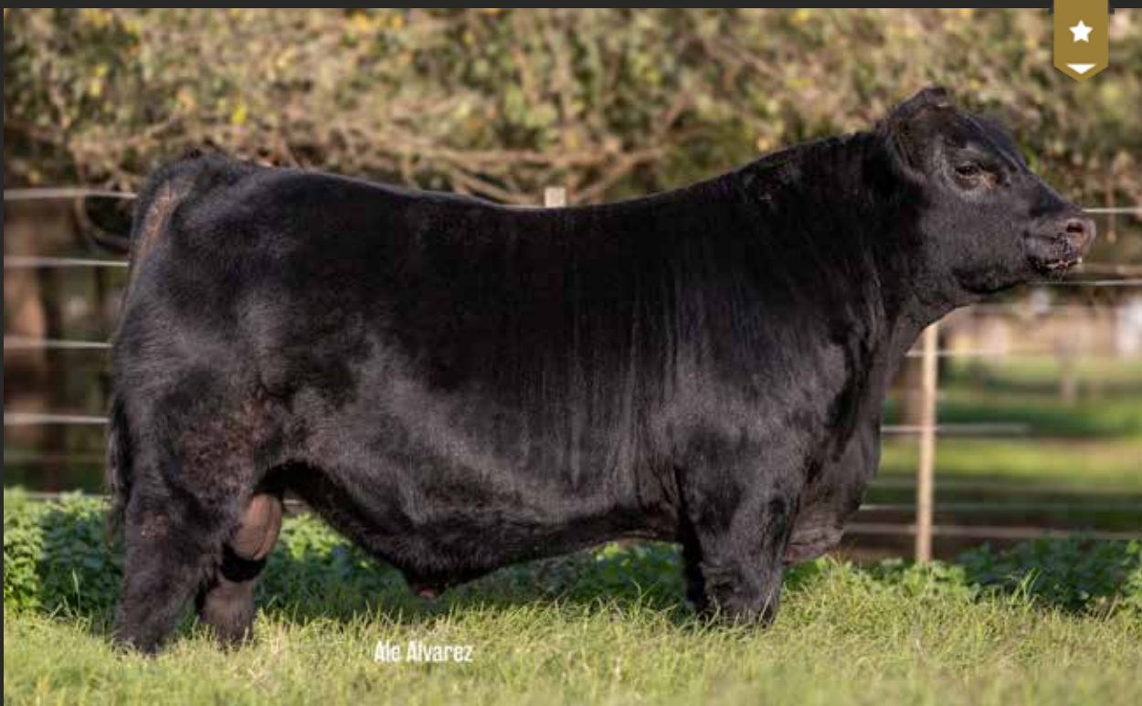
FORJADORA 9399 - Hijo de VIRREY x Forjadora 6936