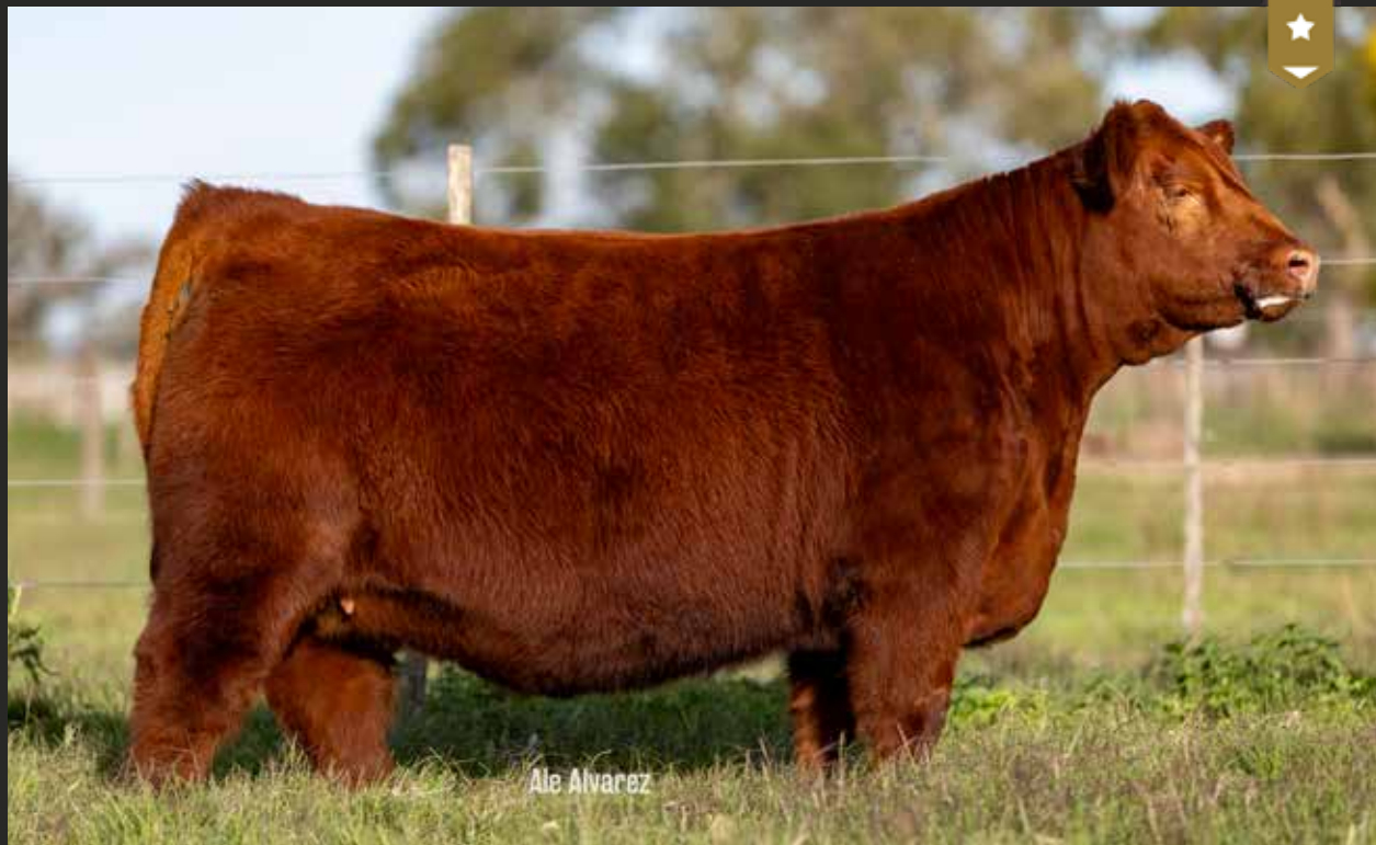
FONTANA 9351 - Hija de VIRREY x Fontana 7643