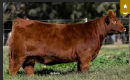
Montana 9351, su hija. Lote Gran Campeón. Ternera Expo Otoño 26