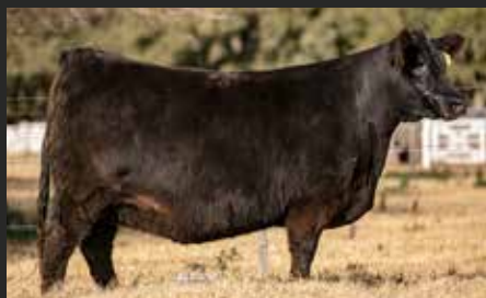
HEIDI 8457, su hija. Int. Lote Gran Campeón Otoño 23