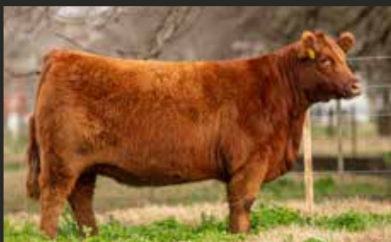
MULATA 8302. Madre de Mulata 8975.