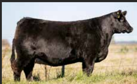
HEIDI 7189, su madre. La mejor hija de Rubeta Bomba en LR.