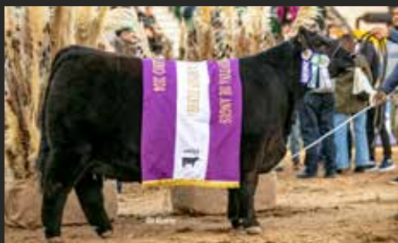
PASION, su hija Res. Gran Campeón Hembra Palermo 24