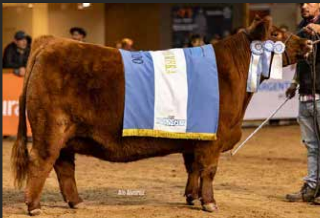
GRAN CAMPEON HEMBRA Y CAMPEON VAQUILLONA INTERMEDIA COLORADA La Rubeta / Monino SA / Frig Modelo Uy.