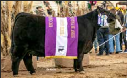
PASIÓN, su hermana. Res. Gran Campeón Hembra Palermo 24.