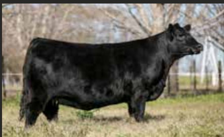
FONTANA 7693. Hija de Fontana 6484 y Madre de BOTIJA.