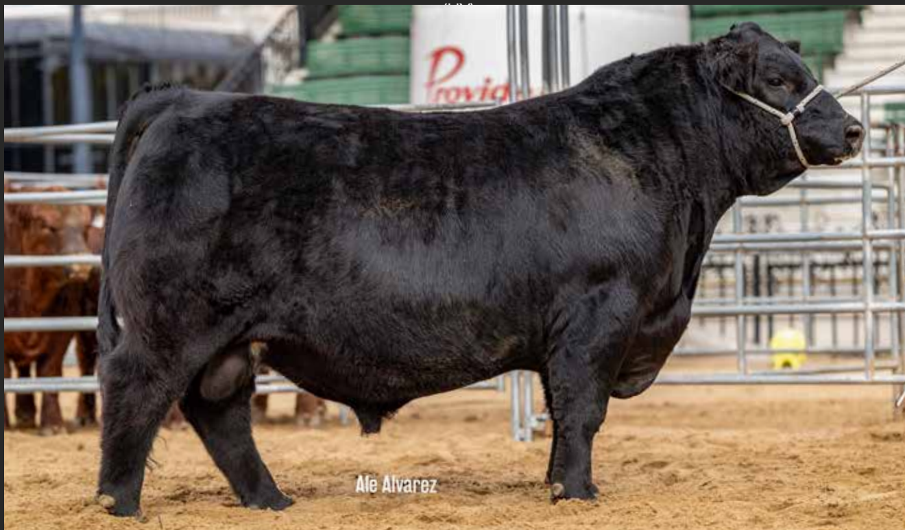
RP 9154 MEJOR TORO INDIVIDUAL DE LOTE