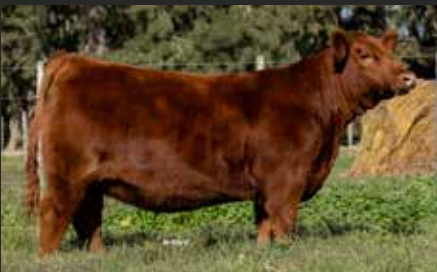
HEIDI 9349, su hija. Ternera Destacada Nueva Generación 2025.