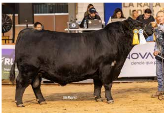
TERCER MEJOR 2° AÑOS MAYOR La Rubeta / La Pasión