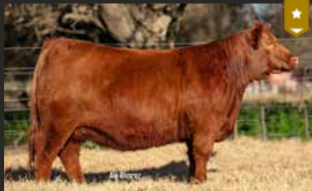
HEIDI 8529, su hija. Precio Máximo Remate LR.

HERMANA MATERNA DE HALCÓN, BI GRAN CAMPEÓN EXPO OTOÑO ANGUS 23 Y 24.