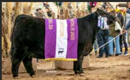
PASIÓN, hija de su propia hermana. Res. Gran Campeón Hembra Palermo 24.