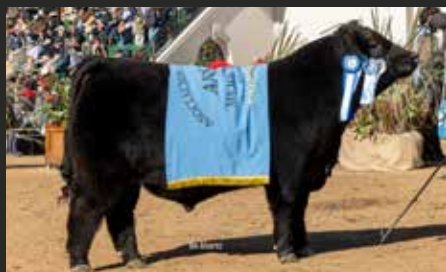
AMALAYA Mejor Ternero y Tercer Mejor Macho Palermo 25.