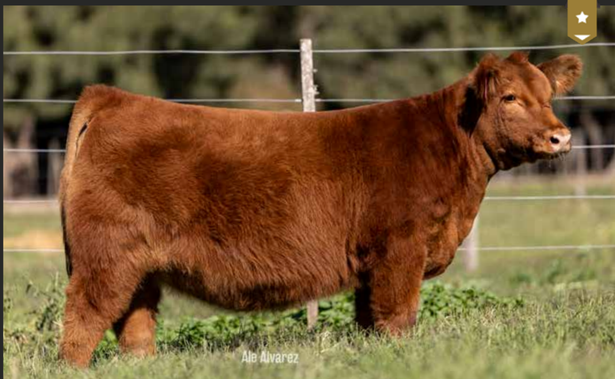
HEIDI 9349 - Hija de RUFIAN x Heidi 8450