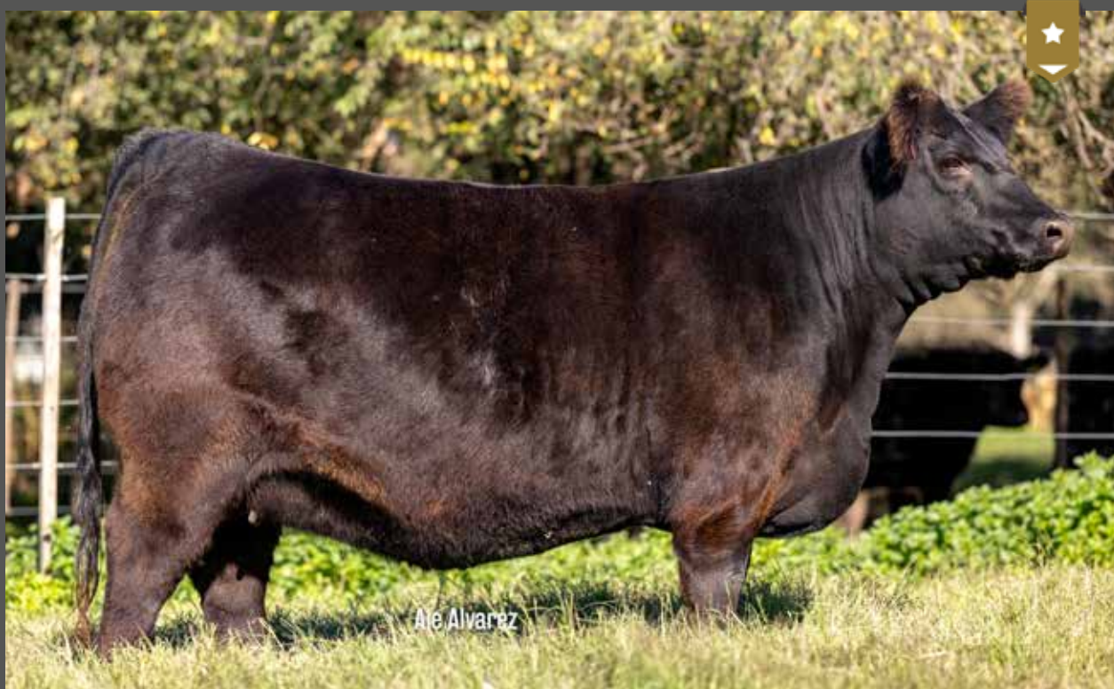
FONTANA 9196 - Hija de DON JOSE x Fontana 8409