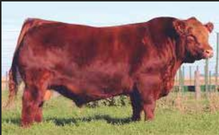
RUFIAN, padre de estos embriones.