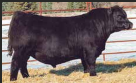
LA JOYA Padre de estos embriones