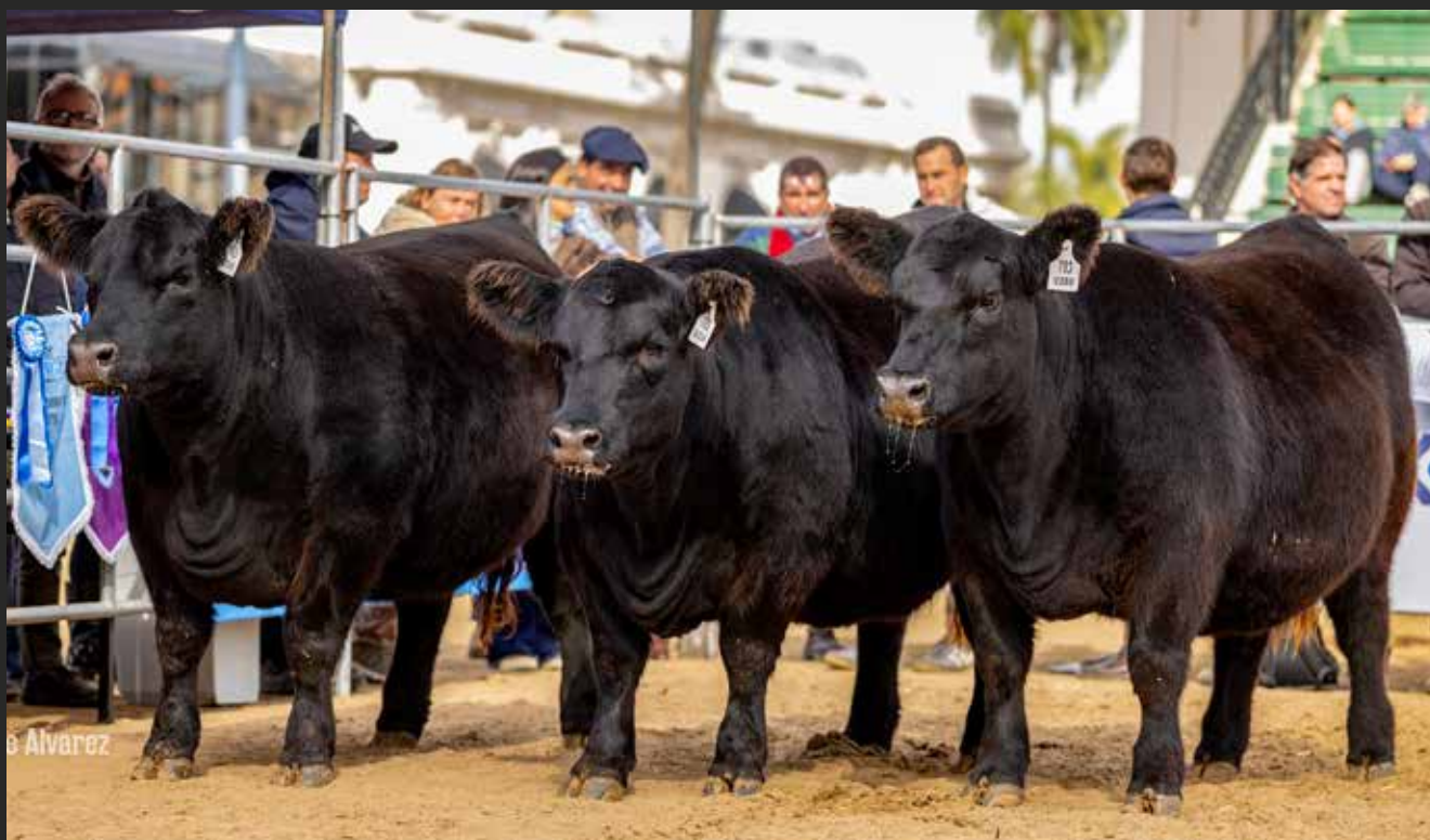
RP 9234, RP 9288 Y RP 9295 LOTE GRAN CAMPEÓN HEMBRA Y CAMPEÓN VAQUILLONA INTERMEDIA