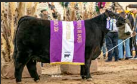
PASIÓN, Su hermana. Reservada Gran Campeón Hembra Palermo 24.