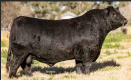
RUBETA 8709, su hijo. Precio Máximo Remate LR 24.