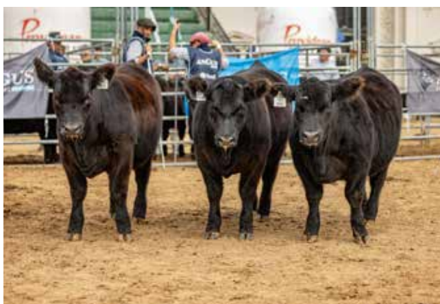
TERCER MEJOR LOTE TERNERA MENOR La Rubeta/ La Pasión