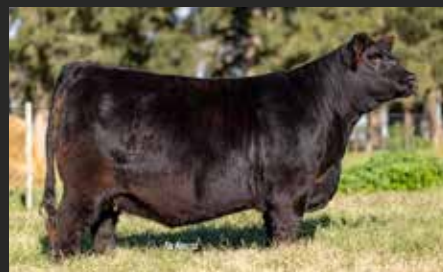
BLACKCAP 9234, su hija. Bi Gran Campeón Hembra lotes Primavera y Otoño