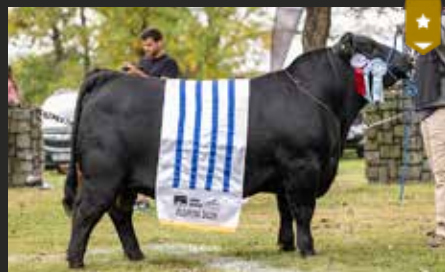
FONTANA 9011. Gran Campeón Macho Expo Florida 26. En Cabaña San Gregorio, Uruguay.