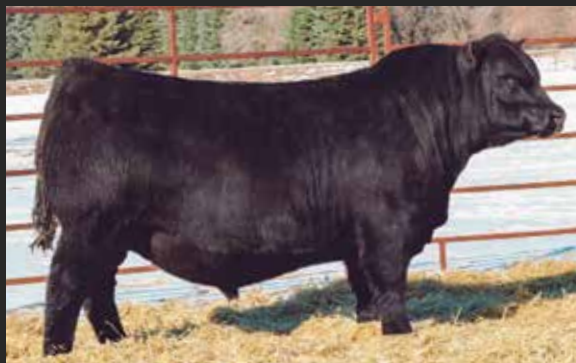
LA JOYA OCC Zodiac x Missing Link