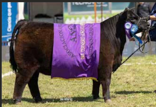
RESERVADA GRAN CAMPEÓN TERNERA La Rubeta – La Cincha