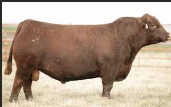
RED BOXER Mann Red Box x Hammelech 8127