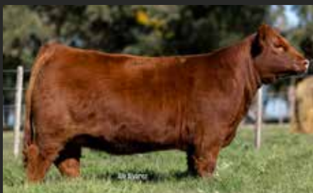
Montana 9354, su hija. Lote Gran Campeón. Ternera Expo Otoño 26