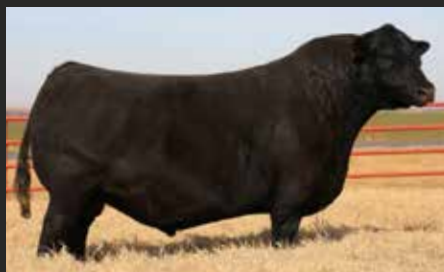
EXTERNAL LAW. Padre de estos embriones.