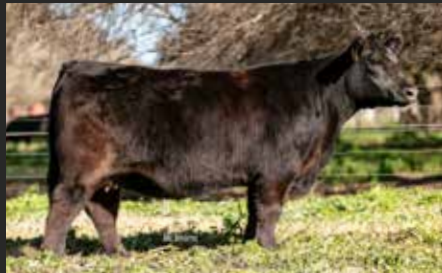
FONTANA 8637, su Hija. Campeón Vaquillona Menor Palermo.