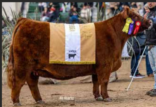
TERCER MEJOR HEMBRA - RESERVADA CAMPEÓN VAQ INTERMEDIA La Rubeta, Monino S.A. y Frig. Modelo