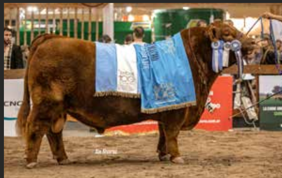
MATEO Entrador - 326 - Brutal