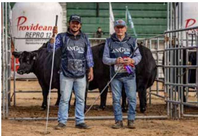
TERCER MEJOR LOTE HEMBRA Y RESERVADO CAMPEON VAQUILLONA INTERMEDIA La Rubeta / La Pasión / G. Mato / Don Benjamín