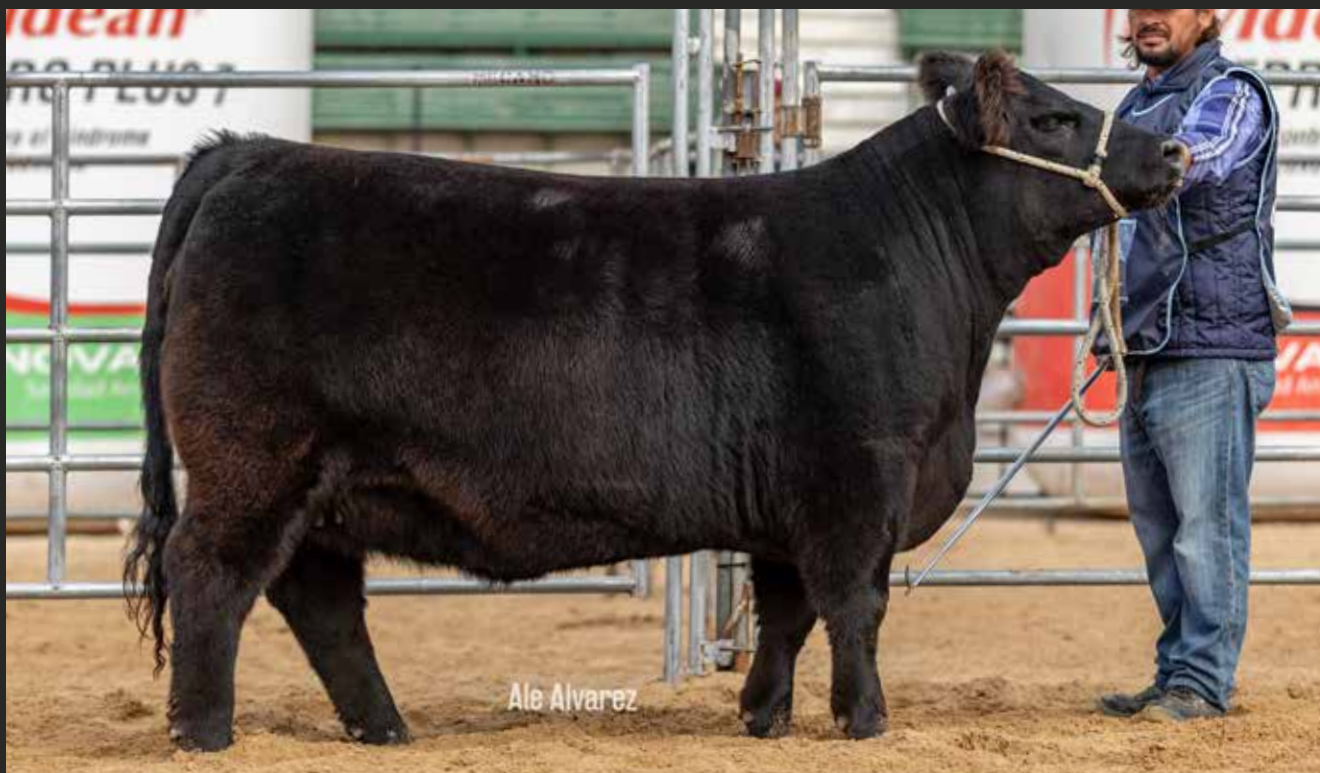
RP 9295 TERCER MEJOR HEMBRA INDIVIDUAL DE LOTE