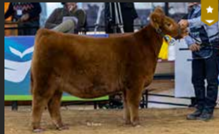
VICTORIA 9508, su hija. Tercer Mejor Ternera Menor Expo Otoño 26