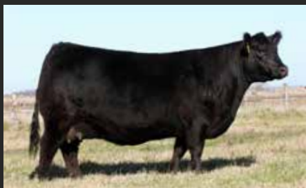
FONTANA 6484, su madre. Donante elite en LR.