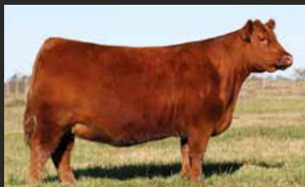
MESITA 6593, su abuela. Una de las donantes elite de LR.