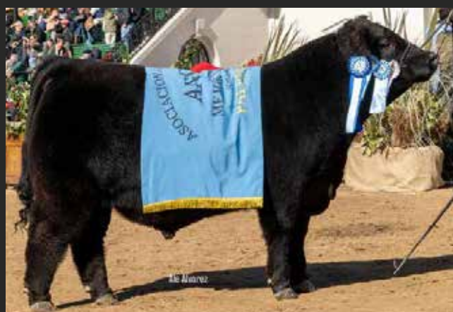
CAMPEÓN TERNERO INTERMEDIO MEJOR TERNERO DE LA EXPOSICIÓN Y 3ER MEJOR MACHO EXPOSICIÓN