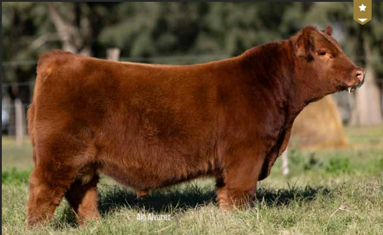
MONTANA 9518 - Hijo de RED BOXER x Montana 7950