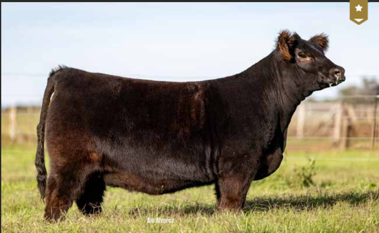
VICKY 456 - Hija de MATEO x Vicky 8186