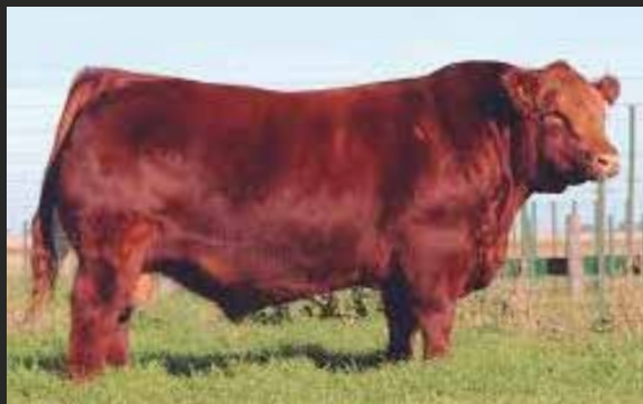
RUFIAN Bandido - 326 - Brutal