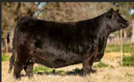
BLACKCAP 8744, su hermana. Int. Lote Tri Gran Campeón Otoño y Nacional 23 y 24