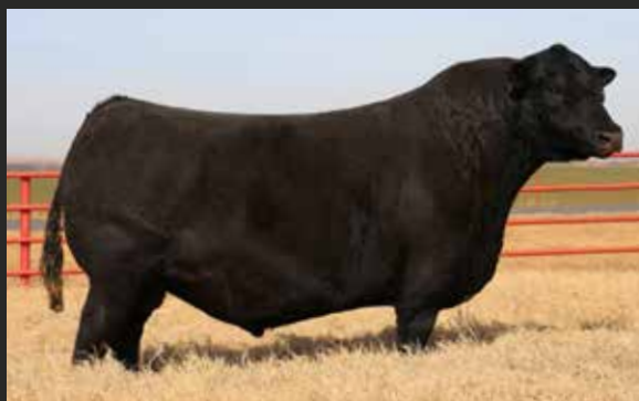
EXTERNAL LAW Napoleon x Natural Law