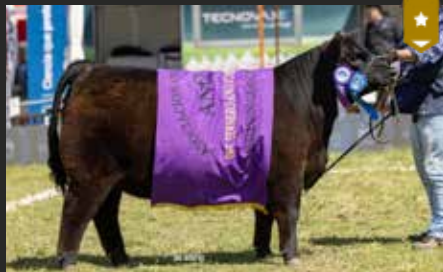
BLACKCAP 9295, su hermana. Res. Gran Campeón Ternera Nacional 25.