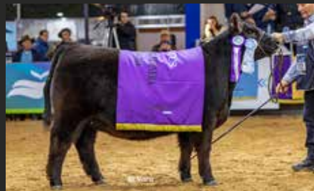
VICKY 456, su hija. Segunda Mejor Ternera Expo Otoño 26