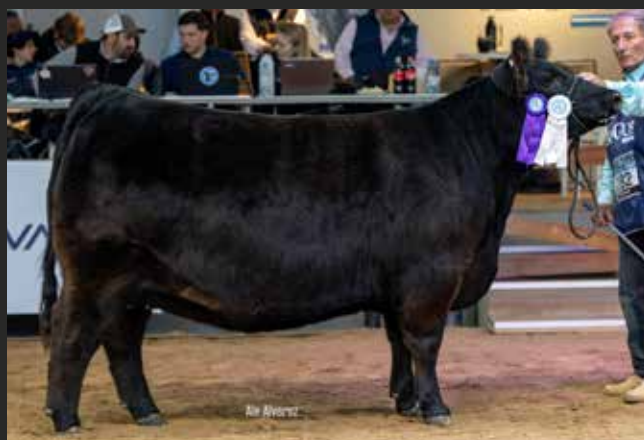
RP 9196 RESERVADA CAMPEON VAO INTERMEDIA Rubeta S.A. - La Pasión - Mato - Bototi Picu