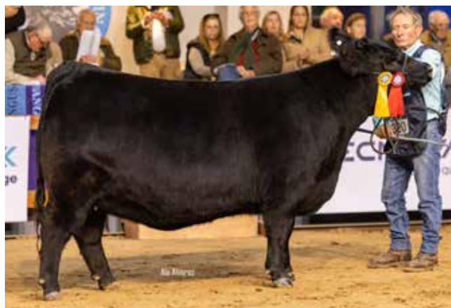
TERCER MEJOR VAQUILLONA MAYOR NEGRA La Rubeta / La Pasión / Mato