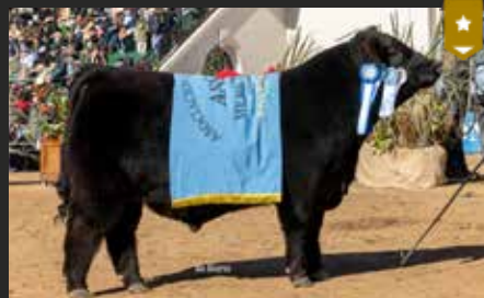
AMALAYA, su hermano. Mejor Ternero y Tercer Mejor Macho Palermo 25.

HIJA DE BLACKCAP 8119 Y GRAN CAMPEÓN HEMBRA DE LOTE CENTENARIO ANGUS.