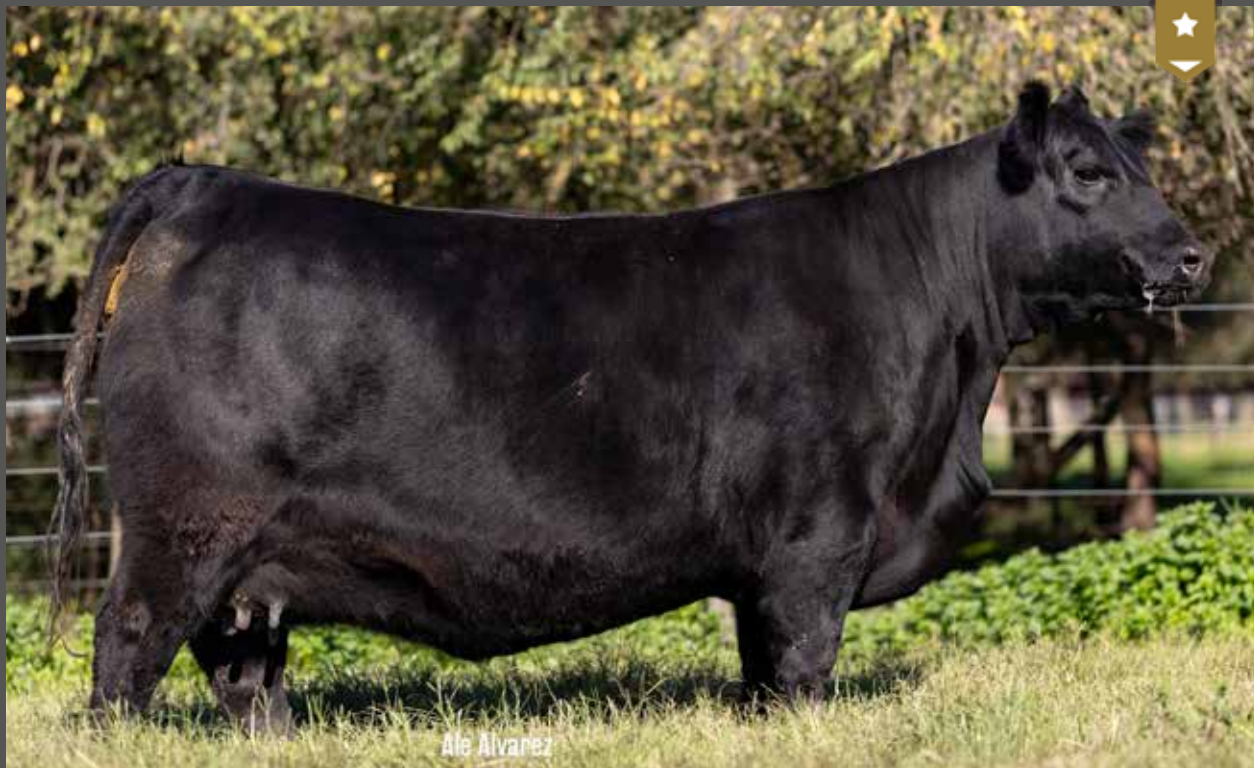
FONTANA 9134 - Hija de LA JOYA x Fontana 7693