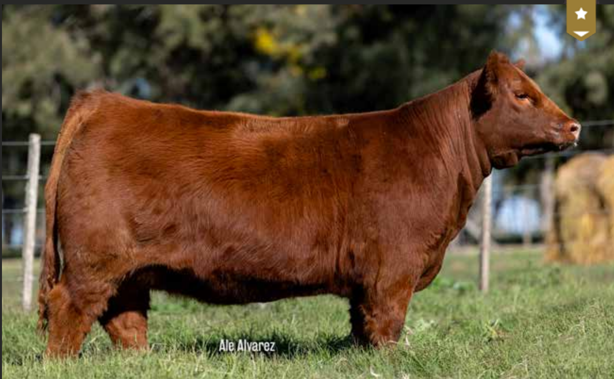
MONTANA 9354 - Hija de HALCON x Montana 7950